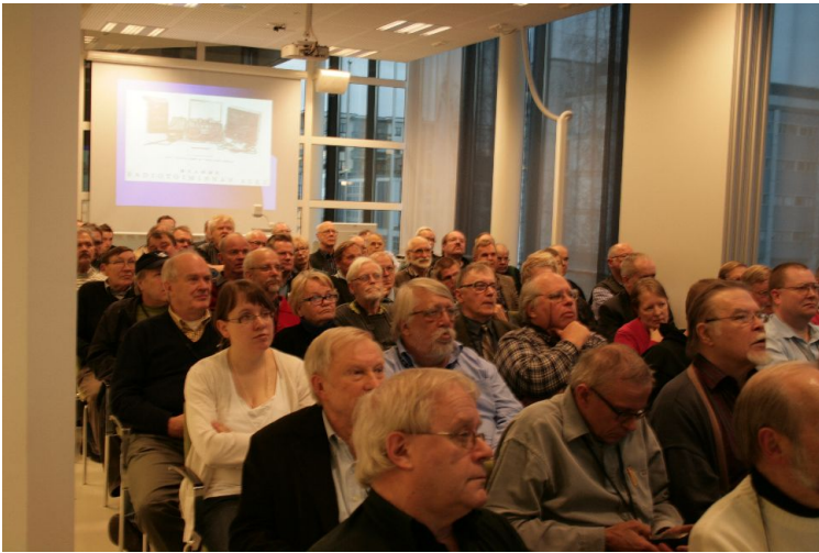
Kuva: Kokousyleisöä Syyspäivillä

Esitelmien lisäksi paikalle oli järjestetty valvottu kirpputori uusimuotoisella huutokauppa-kirpputorilla, DX-kuuntelijoiden tapaaminen, YL-mee-ting, non-stop pätevyystutkinnot, QSL-palvelu, CCF:n nurkka, ilmainen WLAN sekä "Sight Seeing Lahti" ja mm. tutustuminen hiihtomuseoon, vammaisten tapaaminen ja partiotapaaminen.