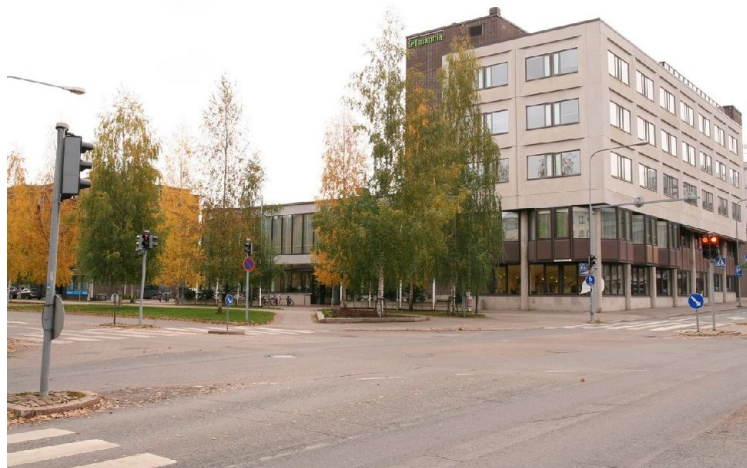
Kuva: Fellmannia tarjosi loistavat puitteet Syyspäiville 2012.

Kerholaisille oli tarjolla myös yleisölennätyksiä huokeaan hintaan.