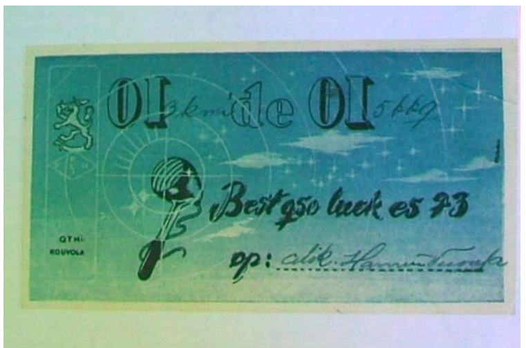
Kuva: OI-kortti SRH-toiminnan kulta-ajalta.

Toiminta hiipui mutta tilalle tuli SRA-toiminta, joka vakiintui 1980-luvun alussa tärkeäksi osaksi viestiyksiköiden toimintaa. Myös SRA-toiminta hiipui ja 1990-luvun alussa SRA-tutkinnosta luovuttiin ja varusmiehet suorittavat normaalin perus- tai yleisluokan tutkinnon.